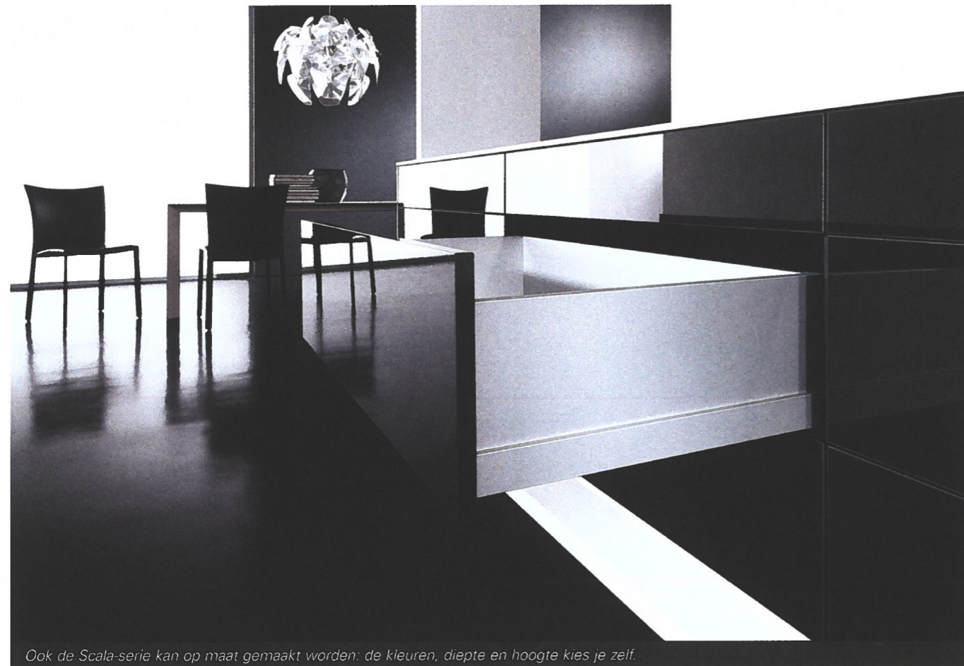
Ook de Scala-serie kan op maat gemaakt worden: de kleuren, diepte en hoogte kies je zelf.

Sinds 1 juni werken Decrui, Van Opstal en Grass samen aan een nieuw concept. Ze spelen in op de veranderingen in de markt en produceren op maat gemaakte lades. Een redelijk unieke samenwerking in de sector. Decrui is een ladefabrikant uit Houthulst, opgericht in 1970. Ze maken zo'n 80.000 houten lades per dag. Grass is een Oostenrijkse systeemleverancier die al meer dan dertig jaar