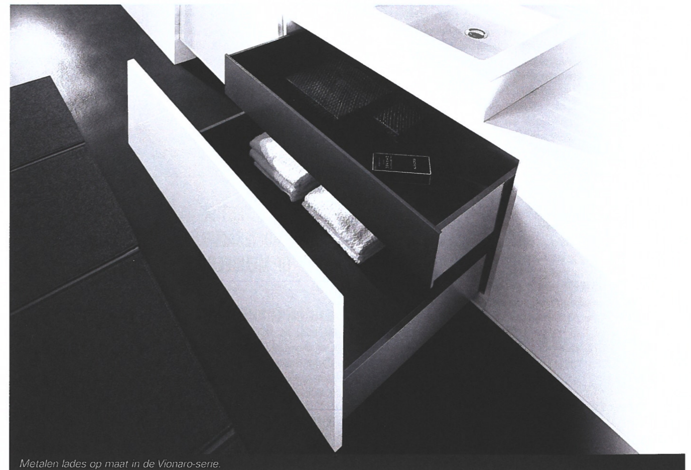
Metalen lades op maat in de Vionaro-serie.

“Via de configurator geef je je wensen, kleur en afmetingen door en stel je zelf de lades samen.”